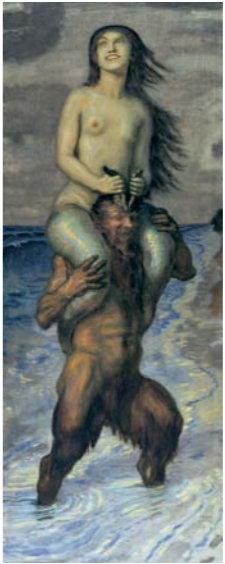
Franz von Stuck Faun und Nixe , 1918 Öl/Leinwand, 175 x 62 cm

Der Ausstellungsteil Elixier der Sehnsucht richtet den Blick auf den Wunsch des Menschen nach Harmonie mit der Natur, wie sie die romantische Landschaftsmalerei von C. D. Friedrich, Morgenstern oder Dahl mit ihren Wasserfällen, Meeresbuchten und stillen Seen verkörpern. Eine Sehnsucht, die, mit Eros und Tod verknüpft, in der symbolistischen Malerei ihren Höhepunkt findet. In den Nixen- und Nymphendarstellungen von Böcklin, Klinger und Stuck kulminiert diese ambivalente Verknüpfung von Wasser und Weib, wie sie auch die Poesie und Literatur der Zeit thematisiert. Ein kurzes Hörspiel, zusammengestellt von Gisela Maria Schmitz und dem Schauspiel München, ergänzt hier den Bildgenuss, bevor der Besucher im angrenzenden Ausstellungsraum mit dem Problem der globalen Trinkwasserversorgung im 21. Jahrhundert konfrontiert wird, eine vom Institut für Wasser- und Abfallwirtschaft der TU München gestaltete Präsentation.