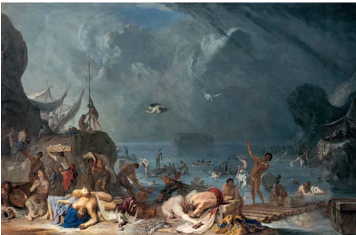
Johann Heinrich Schönfeld Die Sintflut , um 1636/37 Öl/Leinwand, 137,5 x 208 cm

Die Kunsthalle der Hypo-Kulturstiftung realisiert mit Mythos und Naturgewalt Wasser erstmals eine interdisziplinäre Ausstellung. Dies ist der Beitrag der Kunsthalle zum Kultursommer, der anlässlich der Bundesgartenschau 2005 unter dem Motto »Perspektivenwechsel« von den Münchner Institutionen begleitet wird. Am 22. März 2005 hat der Generalsekretär der Vereinten Nationen die Weltwasserdekade ausgerufen und damit verdeutlicht, dass Wasser als Grundlage globaler und menschlicher Existenz die wichtigste Ressource des 21. Jahrhunderts sein wird.