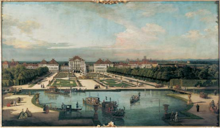
Bernardo Bellotto, gen. Canaletto Schloss Nymphenburg von der Parkseite , 1761 Öl/Leinwand 137 x 237,5 cm

Das in jeder Hinsicht »uferlose« Thema Wasser wird in dieser Ausstellung in fünf Kapitel gegliedert. Anhand von 70 Meisterwerken, vom 16. Jahrhundert bis zur Gegenwart, werden verschiedene kulturhistorisch relevante Aspekte des Wassers veranschaulicht.