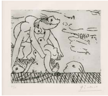
Pablo Picasso Die Rettung der Ertrunkenen , 1932 Radierung, 16 x 19,4 cm Sammlung Klewan

Schwimmen als Sport, zur Stärkung des Körpers und als Freizeitbeschäftigung beginnt erst im 19. Jahrhundert und ist daher ein ganz neues Sujet. Im Gegensatz zum klassischen Motiv der »Badenden«, die Ausdruck einer Suche nach paradiesischer Harmonie sind, spiegelt das Thema des Schwimmers in der Moderne eine völlig veränderte Haltung in der Gesellschaft. So sind im letzten Kapitel, Wasserfreuden , Schwimmer mit Badeanzug und Badekappe im Wasser oder am Badestrand auf Werken von Nolde, Beckmann, Picasso oder Hockney zu sehen. Darauf bezieht sich die Präsentation der Bayerischen Wasserwirtschaft. Modelle der Isar aus Vergangenheit, Gegenwart und Zukunft informieren über die Renaturierung der Münchner Stadtflüsse, die in diesem Jahr wieder Badewasserqualität erreichen sollen.