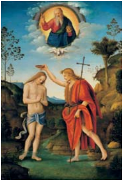
Francesco Ubertini, gen. Bacchiaccha Die Taufe Christi , um 1520 Harztempera/Holz 52,5 x 36 cm