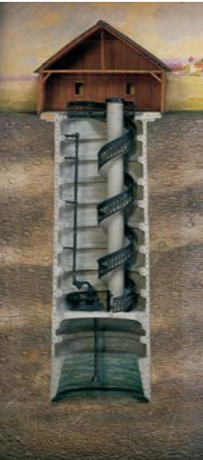
Modell Großer Schachtbrunnen (Ausschnitt), 1913 Gips, 102,5 x 102,5 x 26,5 cm

Das zweite Kapitel, Göttliche Macht – Macht der Natur , widmet sich der Bedrohung durch das Wasser. Motive des 16. und 17. Jahrhunderts, wie »Sintflut« oder »Durchgang durch das Rote Meer«, verstehen die Naturgewalt allein als Ausdruck der Macht Gottes, während zum Ende der Epoche das Thema »Schiffbruch« dominiert. Die Natur selbst wird in der Aufklärung zum Ersatz für das Göttliche. Ergänzend lässt sich anhand der Präsentation des Bereichs GeoRisikoForschung der Münchener Rück interaktiv erfahren, welche Risiken mit dem Zuviel oder Zuwenig von Wasser in der Gegenwart verbunden sind.