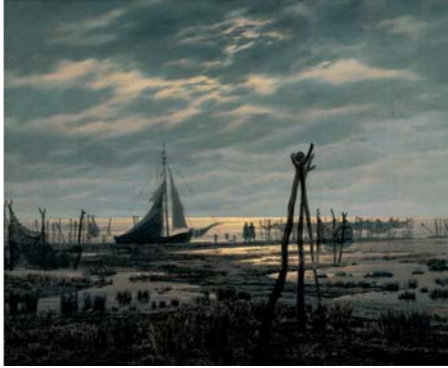
Caspar David Friedrich Sumpfiger Strand , um 1832 Öl/Leinwand, 25,4 x 31 cm © Bayerische Staatsgemäldesammlungen München

Nach diesen metaphorischen Kapiteln wird nun der Blick auf das Wasser als Kulturfaktor gerichtet. Der barocke Garten mit seinen künstlichen Wasserspielen beispielsweise wurde nur möglich durch hoch entwickelte Kanalsysteme, Pumpen und Hebeanlagen. Eine Ansicht von Schloss Nymphenburg, ein Hauptwerk von Bellotto, verbindet die technische mit der ästhetischen Seite des Wassers. Dieses Gemälde steht deshalb im Zentrum des Ausstellungsbereichs ... und macht sich das Wasser untertan. Exponate des Deutschen Museums zeigen dazu die Entwicklung solcher Technik.