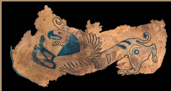
Satteldecke aus Kurgan 2 von Pazyryk mit greifenartigem Fabelwesen Majkop, 5. Jh. v. Chr. Filz, 30 x 65 cm

Mächtige, so genannte Kurgane prägen die eurasische Steppenlandschaft. In solchen Grabhügeln wurden Könige und Fürsten unter größtem Aufwand bestattet. Im Mittelpunkt der Ausstellung stehen die bedeutendsten Prunkinventare aus den Fürstengräbern der einzelnen Regionen: neben Funden aus dem südlichen Sibirien, dem Altaigebirge, dem Südosten Kasachstans und der Region des südlichen Ural werden auch Schätze aus Kurganen östlich und nördlich des Schwarzen Meeres zu sehen sein. Neueste Grabungen haben spektakuläre Funde hervorgebracht: So haben die Dauerfrostböden in den Höhen des Altaigebirges Mumien so hervorragend konserviert, dass Tätowierungen der Haut ebenso wie Teile der Kleidung erhalten sind. Zier- und Gebrauchsgegenstände wie Waffen und Rüstungsteile oder Pferdegeschirr aus Gold und Silber, Holz, Leder oder Textilien vervollständigen das Bild einer versunkenen Epoche. Exponate aus Mittel- und Südosteuropa machen deutlich, dass bereits um die Mitte des 1. Jahrtausends vor Christus ein enger Austausch zwischen Europa und Asien stattfand, ja ein eurasischer Kulturkomplex existierte. In diesem groß angelegten