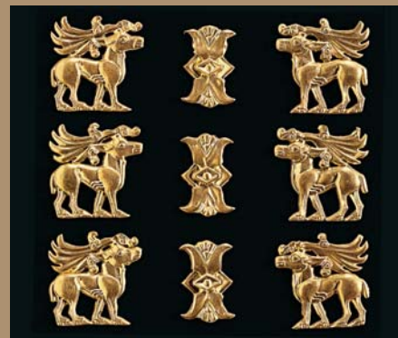
Goldene Zierbleche in Form von Lotusblüten und Hirschen als Kleidungsbesatz, Kuban-Kultur um 450 v. Chr. Höhe: jeweils 2,5–3 cm

Wir danken den Museen und Institutionen aus Deutschland, Kasachstan, Rumänien, Russland, der Ukraine und Ungarn, die sich an der Vorbereitung und Durchführung des Projekts beteiligt haben. Allein durch ihre Hilfe wurde möglich, dass zahlreiche einzigartige Objekte erstmals dem deutschen und europäischen Publikum präsentiert werden können.