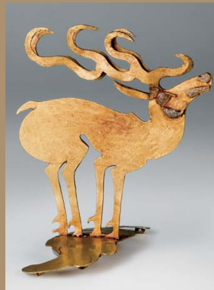
Hirschfigur aus Gold Aržan 2, Ende 7. Jh. v. Chr. Höhe: 6,9 cm

Projekt wird erstmals ein umfassendes Bild der Skythen vermittelt, das uns aufgrund ihrer schriftlosen Kultur bislang in vieler Hinsicht verborgen war. Neben den archäologischen Hinterlassenschaften der Skythen werden auch neueste Forschungserkenntnisse präsentiert.