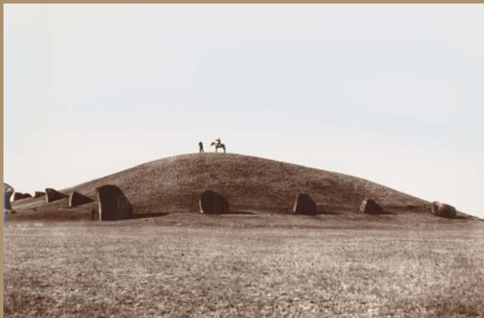
Grabhügel von Salbyk, Tagar-Kultur (Südsibirien) 4. Jh. v. Chr. Durchmesser: 70 m, Höhe: 11 m Fotografie, 1910 MKM Nr. 5501