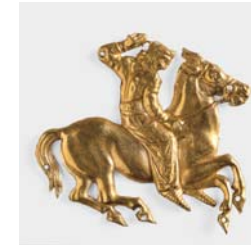
Goldenes Zierplättchen mit Skythendarstellung Kurgan Kul'Oba, Mitte 4. Jh. v. Chr. Höhe 3,5 cm