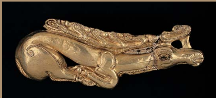
Schildzeichen aus Elekron in Gestalt eines Hirsches mit untergeschlagenen Beinen Tapioszentmartion 6. Jh. v. Chr. Länge: 22,7 cm

Die Skythen und die mit ihnen verwandten nomadischen Völker prägten vom 8. bis 3. vorchristlichen Jahrhundert die Geschichte des eurasischen Steppenraums. In der vom Deutschen Archäologischen Institut und dem Museum für Vor- und Frühgeschichte der Staatlichen Museen zu Berlin konzipierten und organisierten Ausstellung, die in Zusammenarbeit mit der Kunsthalle der Hypo-Kulturstiftung und dem Museum für Kunst und Gewerbe Hamburg realisiert wurde, wird erstmals weltweit in umfassender Weise die Geschichte und Kultur dieser Reitervölker von ihren Ursprungsgebieten entlang des Jenissei bis an die Tore Mitteleuropas präsentiert. »Im Zeichen des goldenen Greifen. Königsgräber der Skythen« steht unter der wissenschaftlichen Leitung von Prof. Dr. Hermann Parzinger, noch Präsident des Deutschen Archäologischen Instituts und in Kürze Präsident der Stiftung Preußischer Kulturbesitz.