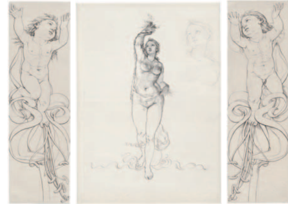
AUSSEN: Der linke Genius auf der Amaryllisblüte, 1809 Der rechte Genius auf der Amaryllisblüte, 1809 beide 60,6 x 18,3 cm Feder in Schwarz über Spuren von Bleistift MITTE: Aurora, 1808 Feder in Schwarz, Bleistift 62,8 x 44,6 cm

Diese Retrospektive gliedert sich in zehn Abschnitte, die teilweise nach gattungsspezifischen, teilweise nach thematischen und medialen Gesichtspunkten geordnet sind. Darüber hin-