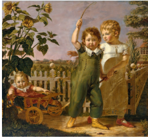
Die Hülsenbeckschen Kinder , 1805/06 Öl/Leinwand, 131,5 x 143,5 cm, Hamburger Kunsthalle

Titelabbildung: Selbstbildnis mit braunem Kragen (Ausschnitt), um 1802 Öl/Leinwand, 37 x 31,5 cm, Hamburger Kunsthalle und Runge Erben