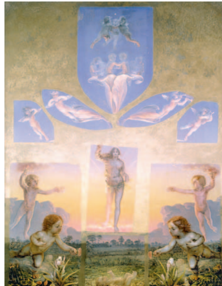
Der große Morgen, 1809 Öl/Leinwand, 152 x 113 cm Hamburger Kunsthalle

Runge war von der Vision beseelt, Malerei, Dichtung, Musik und Architektur in einem Gesamtkunstwerk zu vereinen und betrat damit künstlerisches Neuland. Mit seinen Gemälden versucht er dem zyklischen Naturverständnis