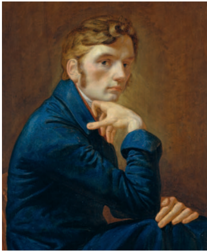
Selbstbildnis im blauen Rock (Ausschnitt), 1805 Öl/Eichenholz 40,3 x 28,9 cm Hamburger Kunsthalle

Die Kunsthalle der Hypo-Kulturstiftung in München zeigt den Romantiker Philipp Otto Runge (1777–1810). Mit seinem künstlerischen Werk wird er erstmals außerhalb Hamburgs in einer umfassenden Retrospektive vorgestellt. Fast 300 Werke präsentieren nahezu das gesamte Œuvre dieses jung verstorbenen Genies. Runge gilt neben Caspar David Friedrich (1774–1840) als wichtigster Begründer der Kunst der deutschen Romantik.