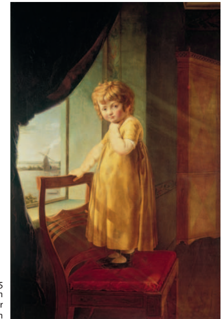
Die kleine Perthes, 1805 Öl/Leinwand, 143,5 x 95 cm Klassik Stiftung Weimar Museen

Anlässlich des 200. Todesjahrs des Künstlers haben Markus Bertsch, Jenns Howoldt und Andreas Stolzenburg, Kuratoren der Hamburger Kunsthalle, diese umfangreiche Ausstellung für Hamburg und München erarbeitet. In der Hamburger Kunsthalle hat die Retrospektive über 100.000 Besucher begeistert.