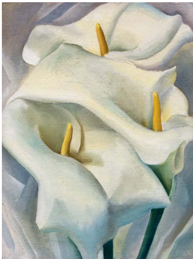
Georgia O'Keeffe Callas , 1924 Öl/Leinwand, 40,6 x 30,5 cm Privatsammlung, Mission Hills

Die wegweisende Pionierin der amerikanischen Kunst ist in Europa erstaunlich selten gezeigt worden. Dank der Zusammenarbeit mit dem Georgia O'Keeffe Museum in Santa Fe ist diese außergewöhnliche Ausstellung möglich, die in drei europäischen Ländern zu sehen ist. Nach der ersten Station in Rom in der Fondazione Roma / Palazzo Cipolla wird die Schau im Anschluss an München noch im Helsinki Art Museum präsentiert.