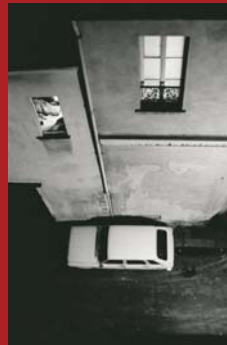
Rue Aubriot, IV Arrondissement Paris, 1977

Akt und Landschaft sind unmittelbar nebeneinander zu sehen. Diese Gegenüberstellung erzeugt spannungsvolle Kontraste: dunkle, wolkenverhangene Seestücke und sich brechende Wellen vor Monte Carlo, barocke Statuen in italienischen Kleinstädten, ein schier endloser Wüsten-Highway nahe Las Vegas, der Berliner Grunewaldsee oder der Rhein aus dem Flugzeugfenster, flankiert von Glamour, Nacktheit und Inszenierungen sexueller Obsessionen. Auch kunsthistorische Topoi wie »Eros und Thanatos« begegnen uns in den Paarbeziehungen von Aktbildern und Stillleben oder Landschaften mit offensichtlicher Vanitassymbolik.