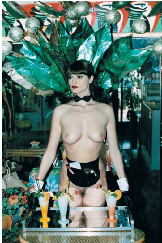
Eva Monte Carlo 1993