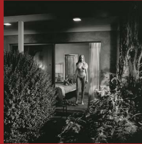
Mulholland Drive Los Angeles, 1989