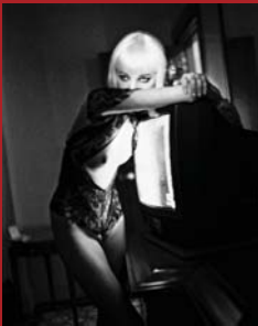
Blonde and TV Hotel Gallia, Milan, 2002 © Helmut Newton

Die Kunsthalle der Hypo-Kulturstiftung zeigt vom 1. September – 1. November 2005 die Ausstellung »Helmut Newton – Sex and Landscapes«. Das Konzept geht auf die Initiative von Simon de Pury zurück. 2001 stellte er in seiner neu eröffneten Züricher Galerie erstmals Newtons Landschaftsbilder dessen freizügigen Aktfotografien gegenüber, die bislang nicht präsentiert worden sind. Die Ausstellung in München umfasst mehr als 80 Fotografien, die jüngsten stammen aus dem Jahr 2002, die ältesten aus den 1970er Jahren. Im Mittelpunkt stehen zwei Aspekte von Newtons Schaffen: Akt und Landschaft in Schwarz-Weiß und Farbe. Die großformatigen Aufnahmen sind an vielen Orten in Europa und Amerika, mit und auch ohne Auftrag, entstanden.