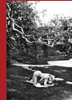
Debra and Red Exterior Beverly Hills, 1991 © Helmut Newton

Gelegentlich scheinen die Frauen in der Newtonschen Bildwelt auf frischer Tat ertappt oder im Gegenteil einem Verbrechen zum Opfer gefallen zu sein. Dies gründet möglicherweise in Newtons Faszination für die Polizeifotografie. Auch der spanische Filmregisseur Luis Buñuel, der sich in seinen Filmen häufig innerhalb der Trias – schöne Frau/sexuelle Obsession/tödliche Dekadenz – bewegte, könnte gelegentlich Pate gestanden haben.