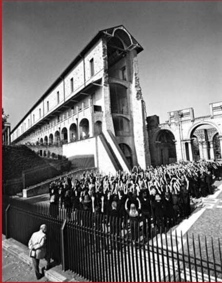
Castello di Rivoli Turin, 1998 © Helmut Newton