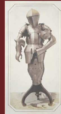
Andreas Groll Turnier-Rüstung von Kaiser Maximilian I. , 1857 Foto/Salzpapier, 29 x 13,5 cm

Anhand von ca. 260 Fotos, unter anderem von Anschütz, Aubry, Bisson, Cameron, Cuvelier, Fenton, Hill & Adamson, Kotzsch, Le Secq, Muybridge, Nègre, Rejlander, Robinson, Talbot, sowie 40 Gemälden und Zeichnungen von Busch, Courbet, Delacroix, Gérôme, Makart, Manet, Menzel, Waldmüller und vielen anderen, kann der Dialog zwischen Fotografie und Malerei nachvollzogen werden. Allein am Verhältnis der Exponate zeigt sich, dass es dieser Ausstellung nicht darum geht, aus den verschiedenen Medien möglichst ähnliche Paare zu bilden, sondern darum, deutlich zu machen, wie die Fotografie im 19. Jahrhundert eine eigenständige Bildwelt und Ästhetik entwickelt hat, die zugleich auf die Tradition der Malerei und Druckgrafik Bezug nimmt.