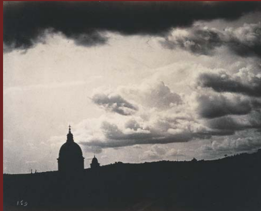
Carlo Simelli Wolkenstudie mit Kuppel in Rom , 1860–62 Foto/Albuminpapier 18 x 22,5 cm

Wie kein anderes Medium, hat die Fotografie die künstlerische Wahrnehmung beeinflusst und damit grundlegende Veränderungen in der bildenden Kunst bewirkt. So waren die ersten Fotografen oft ausgebildete Maler und die Kompositionen der frühen Fotografien entsprachen den Regeln für den Aufbau von Gemälden. Dennoch wurde die Fotografie noch bis zur Mitte des 20. Jahrhunderts als »Maschinenkunst« geringer geschätzt. Ungeachtet solcher Vorurteile wurde sie von Anfang an als Vorlagenstudie und Modellersatz für Architekten, Maler, Bildhauer oder Zeichner zu einem unentbehrlichen Hilfsmittel. Zugleich diente sie der präzisen Naturbeobachtung und als eine Art Korrektiv der menschlichen Wahrnehmung bei der Wiedergabe von Licht und Perspektive. So war es für viele Künstler eine Selbstverständlichkeit, Fotoarchive anzulegen, die Darstellungen aus sämtlichen Anwendungsbereichen enthielten, um sie für ihre Malerei zu nutzen.