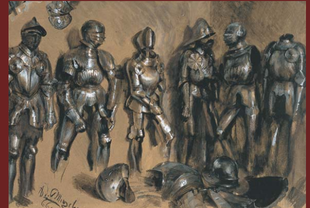
Adolph von Menzel Sechs stehende Rüstungen vor einer Wand , 1866 Gouache, 38,3 x 52,3 cm

Die Kunsthalle der Hypo-Kulturstiftung in München widmet der spannenden Wechselbeziehung zwischen Fotografie und Malerei im 19. Jahrhundert erstmals seit 25 Jahren wieder eine umfassende Ausstellung im deutschsprachigen Raum. Als Kurator konnte für dieses Projekt der Leiter des Fotomuseums im Münchner Stadtmuseum, Dr. Ulrich Pohlmann, gewonnen werden. Beginnend mit den frühesten Fotos von William Henry Fox Talbot, dem Erfinder des Negativ-Verfahrens, fächert die Ausstellung alle Themen auf, in denen sich das neue Medium innerhalb der ersten 50 Jahre versuchte: Ausgehend vom Menschen, der in Porträt, Akt und wissenschaftlicher Anatomiestudie erscheint, über Tierbilder und Stilleben zur Landschaft, die sich in Wald- und Wiesenansichten, Berg- und Meeresmotiven, Wolken- und Himmelsstudien gliedert. Zu den Stadtansichten und Architekturaufnahmen kamen auch die zeitgenössischen Baudenkmale der Ingenieurkunst, Zeugnisse der Industriekultur. Weitere Kapitel widmen sich dem Orientalismus, den Präraffaeliten und der Kunstproduktion.