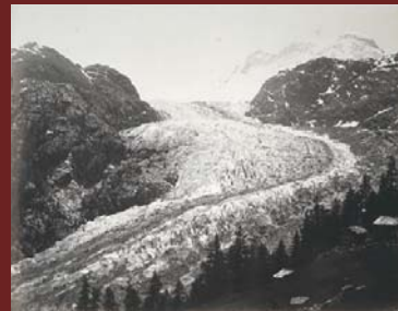
rechts: Eugene Viollet-Le-Duc , Gletscher von Bois und Tal von Chamonix , 1874 Kreide, Aquarell, Gouache/Papier 29 x 69,5 cm Privatsammlung