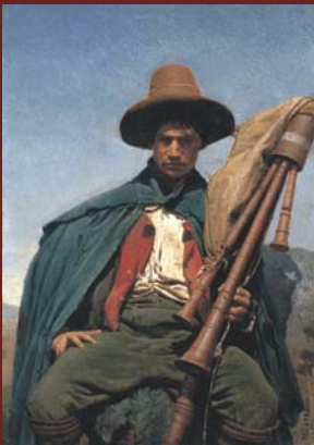
links: Jean-Léon Gérôme Pifferaro, 1854 Öl/Holz 18 x 12,7 cm