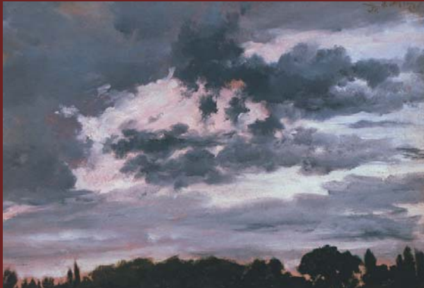
Adolph von Menzel Wolkenstudie , 1851 Öl/L., 28 x 40 cm

Wie kein anderes Medium, hat die Fotografie die künstlerische Wahrnehmung beeinflusst und damit grundlegende Veränderungen in der bildenden Kunst bewirkt. So waren die ersten Fotografen oft ausgebildete Maler und die Kompositionen der frühen Fotografien entsprachen den Regeln für den Aufbau von Gemälden. Dennoch wurde die Fotografie noch bis zur Mitte des 20. Jahrhunderts als »Maschinenkunst« geringer geschätzt. Ungeachtet solcher Vorurteile wurde sie von Anfang an als Vorlagenstudie und Modellersatz für Architekten, Maler, Bildhauer oder Zeichner zu einem unentbehrlichen Hilfsmittel. Zugleich diente sie der präzisen Naturbeobachtung und als eine Art Korrektiv der menschlichen Wahrnehmung bei der Wiedergabe von Licht und Perspektive. So war es für viele Künstler eine Selbstverständlichkeit, Fotoarchive anzulegen, die Darstellungen aus sämtlichen Anwendungsbereichen enthielten, um sie für ihre Malerei zu nutzen.