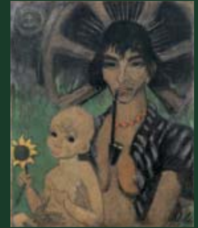
Otto Mueller Zigeunermadonna , 1926 Leimfarbe/Rupfen 87 x 70,5 cm