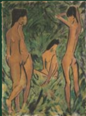
Otto Mueller Knabe vor zwei stehenden und einem sitzenden Mädchen , 1918/19 Leimfarbe/Rupfen 120,2 x 88,2 cm

Der 1874 im schlesischen Liebau geborene Otto Mueller zog nach kurzem Studium an der Dresdner Akademie 1908 nach Berlin, wo er sich für kurze Zeit den Künstlern der »Brücke« anschloss. Im Vergleich zu deren aggressiv farbigen Bildern, die das Thema Großstadtleben umkreisen, sind seine zurückhaltenden Kompositionen, meist Badende in unberührter Landschaft oder Akte im Atelier, Ausdruck einer Sehnsucht nach Harmonie zwischen Mensch und Natur.