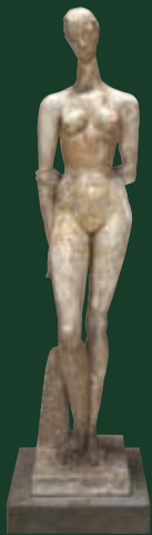
Wilhelm Lehmbruck Große Sinnende , 1913/14 Bronze, 208 cm Neue Nationalgalerie, SMPK, Berlin

Von 1992 bis 2002 wurde im Museum Folkwang Essen am Verzeichnis der Gemälde und Papierarbeiten von Otto Mueller gearbeitet. Anlässlich der ersten Veröffentlichung dieses lang erwarteten Werkkataloges auf CD-Rom zeigt die Kunsthalle der Hypo-Kulturstiftung in München eine große Ausstellung dieses stillen Expressionisten.