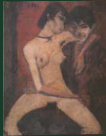
Otto Mueller Liebespaar um 1920 Leimfarbe/Mischtechnik/ Rupfen, 119 x 93,5 cm Privatsammlung