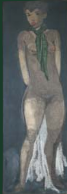
Otto Mueller Mädchen mit grünem Schal 1929/30 Leimfarbe/Rupfen 168 x 60 cm Privatbesitz

Zeitgleich mit seiner ersten größeren Ausstellung in der Galerie Paul Cassirer 1919 erhielt Mueller eine Berufung an die Breslauer Akademie, wo er bis zu seinem frühen Tod 1930 lehrte. Den von Carl Hauptmann 1907 ins Leben gerufenen Mythos seiner angeblichen Zigeunerherkunft nährte er selbst durch eine Werkgruppe mit Zigeunermotiven, die auf zahlreichen Reisen in den Balkan zwischen 1924 bis 1930 entstanden.