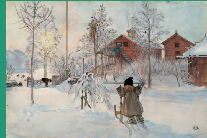
Brita mit dem Lastschlitten, 1900 Aquarell, 32 x 43 cm

Als Begleitprogramm wird im Videoraum täglich der Film »Carl Larsson malt, zeichnet und erzählt« (42 min.) gezeigt.