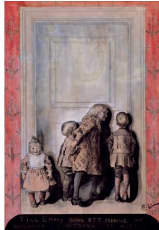
Der Tag vor dem Weihnachtsabend, 1892 Zeichnung und Aquarell 47,5 x 33 cm

Dr. Cecilia Lengfeld, Kunsthistorikerin aus Schweden