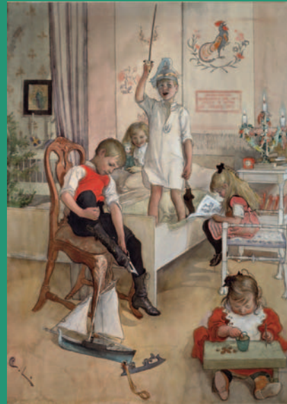
Am Morgen des Weihnachtstages, 1894 Aquarell, 60 x 43 cm Privatbesitz

Jeder der Schweden kennt, besonders die Heimat Larssons in der Provinz Dalaarna und dort den Zauberort Sundborn wird von der Kunst Larssons fasziniert. Bis heute existiert die Traumwelt »Lilla Hyttnäs« als Familienmuseum – nicht museal präsentiert, sondern so belassen wie nach Carl Larssons Tod. Bis heute wird das Haus zeitweise von der Familie und Freunden bewohnt. Die Atmosphäre dieses Zentrums seines künstlerischen Schaffens, das jährlich hunderttausend Besucher anzieht, wird nun drei Monate in der Kunsthalle der Hypo-Kulturstiftung zu erleben sein.