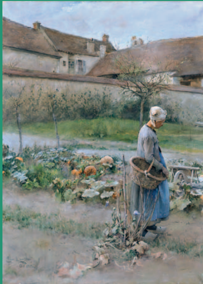
Oktober, 1882 Aquarell und Gouache 73 x 54 cm © Göteborgs Konstmuseum

Die Kunsthalle der Hypo-Kulturstiftung zeigt über die Weihnachtszeit vom 18. November bis zum 5. Februar 2006 die Ausstellung »Carl Larsson – Ein schwedisches Märchen«.