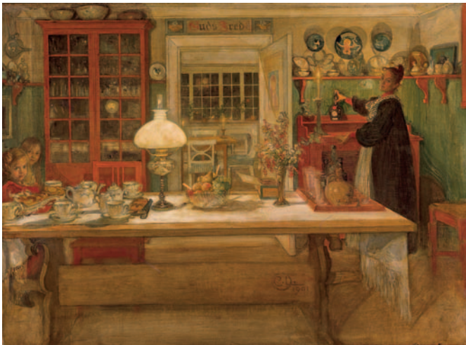
Vorbereitungen zu einem kleinen Spiel, 1901 Öl/Leinwand, 68 x 92 cm

18 th November 2005 to 5 th February 2006