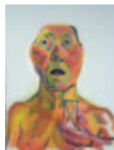
Maria Lassnig Die Sanduhr (Stundenglas) 2001 Öl/Leinwand, 205 x 157 cm Besitz der Künstlerin

Reiz liegt im Dialog der verschiedenen Generationen, denn »Altmeister«, wie Lucian Freud, Eric Fischl, Mel Ramos, Alex Katz oder Maria Lassnig sind ebenso zu sehen wie Jungstars der Szene, Neo Rauch, Jenny Saville, John Currin oder Glenn Brown, um einige wenige zu nennen. Aber auch weitgehend unbekannte Künstler können und sollen in dieser Ausstellung entdeckt werden.