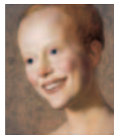
John Currin Little Head, 2000 Öl/Leinwand, 35,5 x 30,5 cm Private Collection courtesy Sadie Coles HQ, London © John Currin