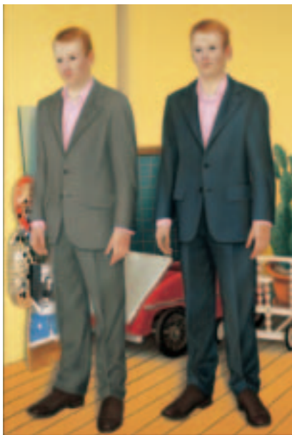
Almut Heise Zwei Galeristen, 2003 Öl/Leinwand, 140 x 95 cm courtesy Galerie Crone © Almut Heise Foto Galerie Crone

In diesem Sommer zeigt die Kunsthalle der Hypo-Kulturstiftung eine große Gruppenausstellung unter dem Titel Zurück zur Figur. Malerei der Gegenwart . Als Reaktion auf den figurativen Malerei-Boom, den der Kunstmarkt in den letzten Jahren verzeichnet hat, versammelt dieses Projekt Bilder von 80 nationalen und internationalen Künstlern.