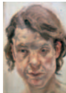
Lucian Freud Head of a Naked Girl 1999– 2000 Öl/Leinwand, 43,8 x 33,5 cm Sammlung Lambrecht- Schadeberg, Rubenspreis- träger im Museum für Gegenwartskunst Siegen © Lucian Freud