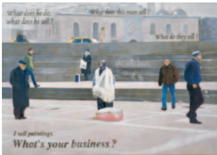
Johanna Kandl o.T. (Whats your business?) 2005 Eitempera/Holz 170 x 243 cm Harry Schmitz, München courtesy Christine König Galerie, Wien © Johanna Kandl Foto George Meister

In diesem Sommer zeigt die Kunsthalle der Hypo-Kulturstiftung eine große Gruppenausstellung unter dem Titel Zurück zur Figur. Malerei der Gegenwart . Als Reaktion auf den figurativen Malerei-Boom, den der Kunstmarkt in den letzten Jahren verzeichnet hat, versammelt dieses Projekt Bilder von 80 nationalen und internationalen Künstlern.