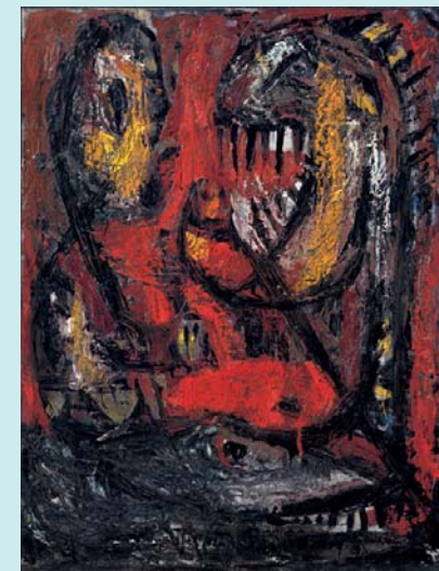
Asger Jorn Herr und Diener , 1949/50 Öl/Leinwand, 62,2 x 47,3 cm © VG Bild-Kunst, Bonn 2006

Im Jahr 2000 gelangen durch die großzügige Schenkung Otto van de Loos über 200 Arbeiten in die Kunsthalle. So wird die Emdener Sammlung durch wichtige Werke des »Informel« wie auch durch Arbeiten der Künstlergruppen »COBRA« und »Spur« bereichert