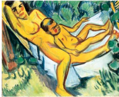
Hermann Max Pechstein Hängematte I , 1919 Ö/Leinwand, 80,5 x 100,8 cm © Pechstein/Hamburg-Tökendorf

6. März: Von der Vision zum Besuchermagneten – Die Geschichte der Kunsthalle in Emden Eske Nannen, Geschäftsführerin der Stiftung Henri und Eske Nannen und Schenkung Otto van de Loo