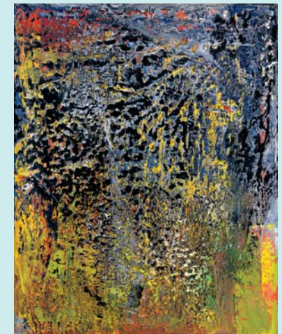
Gerhard Richter Abstraktes Bild , 1988 Öl/Leinwand, 200,3 x 160,8 cm © Gerhard Richter

Die Kunsthalle der Hypo-Kulturstiftung stellt mit über 100 Gemälden, Papierarbeiten und Skulpturen erstmals diese von persönlicher Leidenschaft geprägte Sammlung aus dem hohen Norden Deutschlands in München vor.