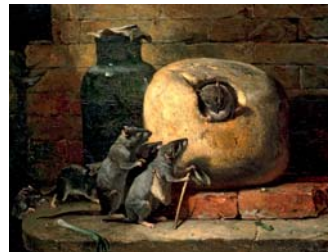
Philippe Rousseau Die Ratte, die sich von der Welt zurückzog (Ausschnitt), 1885 Öl/Leinwand, 81 x 100 cm Musée des Beaux-Arts, Lyon