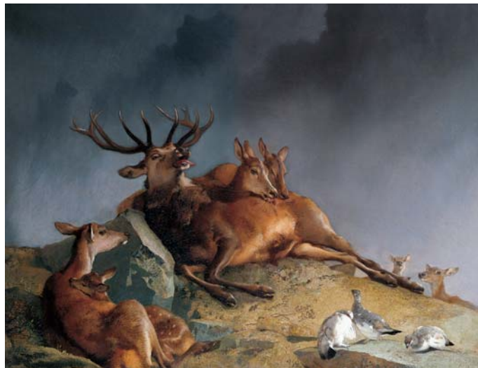
Sir Edwin Henry Landseer Die Pflegerinnen des Hochgebirges , 1854 Öl/Leinwand, 70 x 89 cm French & Company, N.Y.

Für sein Studio engagierte Disney die besten Zeichner, viele von ihnen kamen aus Europa, wo sie eine klassisch-akademische Ausbildung absolviert hatten. So zum Beispiel der Schweizer Albert Hurter (1883–1942), der Schwede Gustaf Tenggren (1896–1970) oder der Däne Kay Nielsen