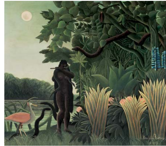
Henri Rousseau Die Schlangenbeschwörerin , 1907 Öl/Leinwand, 169 x 189,5 cm Musée d'Orsay, Paris

(1886–1957). Sie kombinierten ihre Kenntnis der europäischen Kunst und Folklore verschiedenster Epochen mit den Einflüssen ihrer neuen Heimat Amerika. Dies war die ideale Voraussetzung für eine innovative Bildsprache, die dann die ganze Welt eroberte.