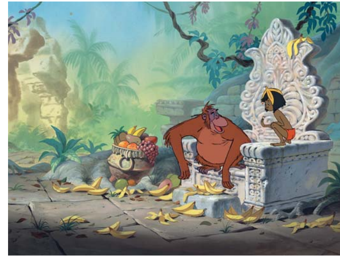
Anonym Das Dschungelbuch – Mogli und König Louie (Ausschnitt), 1967 Cel set-up, Gouache, 32,7 x 101 cm Burbank, Walt Disney Animation Studios and the Animation Research Library © Disney Enterprises, Inc.

Supérieure des Beaux-Arts, und Roger Diederer, Kurator der Kunsthalle, adaptierten diese außergewöhnliche Ausstellung für München, die im Anschluss noch im Helsinki City Art Museum zu sehen sein wird (25. 2.– 31. 5. 2009). Neben vielen Leihgebern aus aller Welt danken wir besonders der Disney Animation Research Library und dem Musée d'Orsay für die großzügige Unterstützung des Projekts.