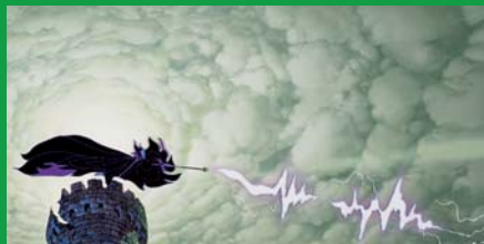
Eyvind Earle Dornröschen , 1959 (Ausschnitt) Malefiz schleudert Blitze Cel Set-up, Gouache 29,5 x 76,2 cm Münchener Stadtmuseum

English language lecture on October 14, see Begleitprogramm .