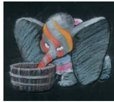
Anonym Dumbo – Von einem Fass trinkend , 1941 Pastell/Papier, 25 x 30,5 cm Burbank, Walt Disney Animation Studios and the Animation Research Library

Künstler, denn Walt Disney selbst hatte das Zeichnen schon früh aufgegeben, um sich ganz seinem eigentlichen Talent, der Erzählkunst zu widmen. Er konzentrierte sich darauf literarische und künstlerische Quellen zu entdecken, die er dann von seinen hochbegabten Künstlern in Meisterwerke der Animation umsetzen ließ.