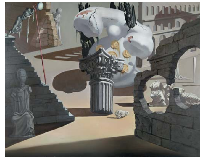
Salvador Dalí , Destino – Weißes Telefon und Ruinen , 1946, Öl/Holz, 47,9 x 60,6 cm Burbank, Walt Disney Animation Studios and the Animation Research Library © Disney Enterprises, Inc.

Supérieure des Beaux-Arts, und Roger Diederer, Kurator der Kunsthalle, adaptierten diese außergewöhnliche Ausstellung für München, die im Anschluss noch im Helsinki City Art Museum zu sehen sein wird (25. 2.– 31. 5. 2009). Neben vielen Leihgebern aus aller Welt danken wir besonders der Disney Animation Research Library und dem Musée d'Orsay für die großzügige Unterstützung des Projekts.