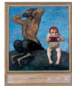
Franz von Stuck Dissonanz , 1910 Öl/Holz, 76 x 70 cm Museum Villa Stuck, München

Diese faszinierende, multimediale Ausstellung bietet überraschende Einblicke in die Bildwelt des Meistererzählers Walt Disney (1901–1966). Jeder kennt die großen Klassiker des Zeichentrickfilms, wie Schneewittchen und die sieben Zwerge (1937), Fantasia (1940) oder Das Dschungelbuch (1967). Dennoch bemerken nur die wenigsten, wie tief die Bilder dieser Filme in der europäischen Kunst und Literatur des 19. und 20. Jahrhunderts wurzeln. In der Gegenüberstellung von Originalzeichnungen, Maleisen, Figurmodellen und Filmausschnitten des frühen Disney Studios (1928–1967) mit Gemälden und Skulpturen von Künstlern der deutschen Romantik, des französischen Symbolismus, der viktorianischen Malerei und des Surrealismus zeigt die Ausstellung konkrete Verbindungen zwischen der populären und der hohen Kunst, zwischen Literatur und Film sowie zwischen der amerikanischen und europäischen Kultur.