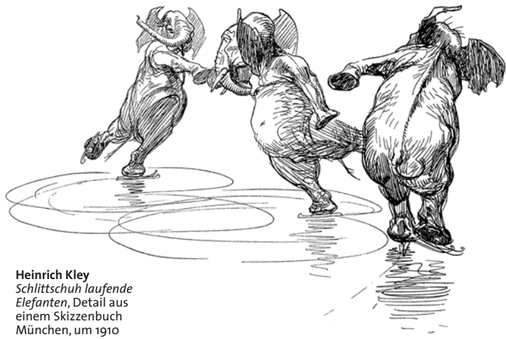
Heinrich Kley Schlittschuh laufende Elefanten , Detail aus einem Skizzenbuch München, um 1910